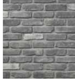
Old Brick Queens