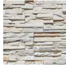
Fast Set Himalaya