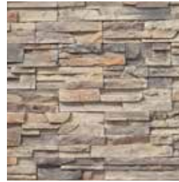
Fast Set Calabria