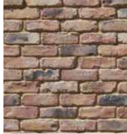
Old Brick Boston