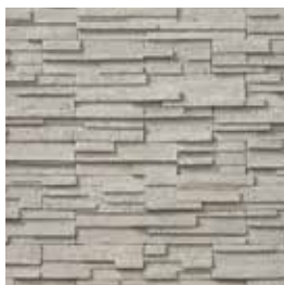
Vulcano Santa Helena