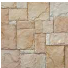
Castillo Europeo Beige