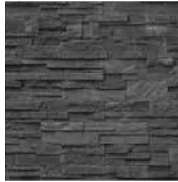
Fast Set Basalto