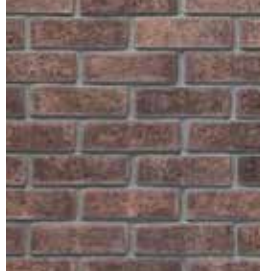
Corcho New Jersey