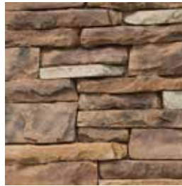
Apilable Santa Fe