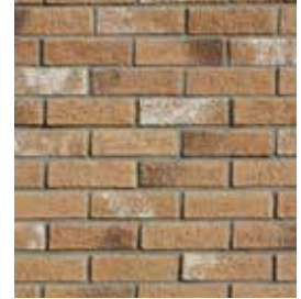
Rústica Pueblo Viejo