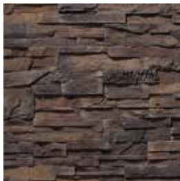
Fast Set Terracota