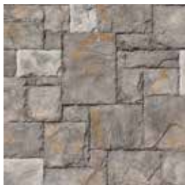
Castillo Europeo Gris