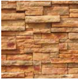
Country Stack Beige