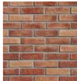
Árabe Rojo Cardenal

* Las fotografías y los colores incluidos en este catálogo son aproximados a la realidad. Recomendamos examinar las muestras reales con su distribuidor autorizado.