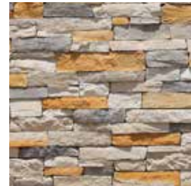
Mountain Ledge Bianco