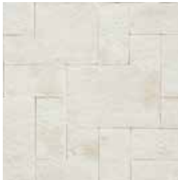
Galarza Mixta Blanco